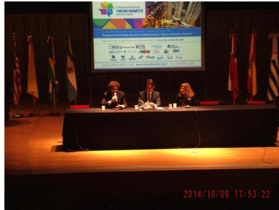
Acto de Clausura

Con respecto a la participación de la USAL, hubo varias Unidades Académicas y Administrativas de la Universidad que intervinieron en el Congreso: